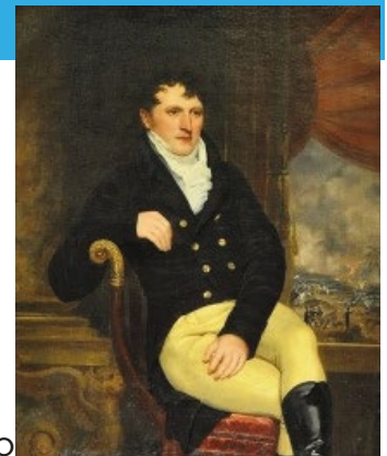
Retrato del Gral. Manuel Belgrano Atribuido a Francois Carbonnier