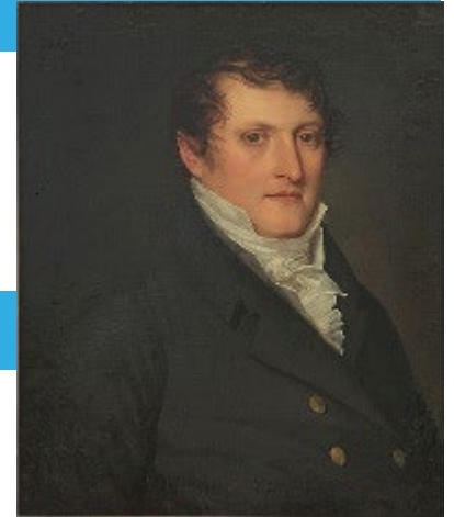
Retrato del Gral. Manuel Belgrano Atribuido a F. Carbonnier MNBA

Propuso y, en muchos casos logró, la defensa de especies, vegetales y animales, como en el caso de la prohibición de matanza indiscriminada de ganado vacuno y yeguarizo.