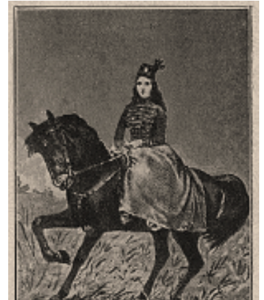
Retrato de Juana Azurduy – Datos desconocidos

Tal es el caso de Juana Azurduy, que dió gran apoyo bélico a Güemes. Belgrano destacó ante el Gobierno su heroica acción y le fue otorgado, por decreto de Pueyrredón, el grado Teniente Coronel de las Milicias Partidarias de los Decididos del Perú, con derecho al uso de uniforme. El 13 de agosto de 1816, Belgrano hizo efectivo el decreto, pero, en lugar de otorgarle el sable correspondiente, le dio el suyo, el que lo había acompañado en Salta, Tucumán y durante el éxodo jujeño.