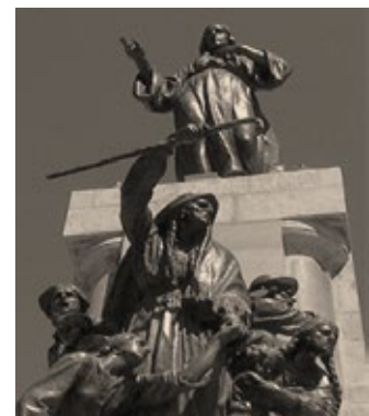
Monumento a las heroínas de La Coronilla. Cochabamba

Mujeres reconocidas y admiradas por Belgrano por dar dura batalla, atrincheradas en La Coronilla, al ser atacada Cochabamba tras la partida del Ejército Patriota. Y, aunque fueron derrotadas, no dejaron de defenderse como el más bravo de los soldados. Fueron consideradas heroínas y en su honor, el 27 de mayo es el Día de la Madre en Bolivia. Belgrano, admirador de la mujer y de su valor en la sociedad y, más aún en este caso, en el campo de batalla, dijo: Gloria a las