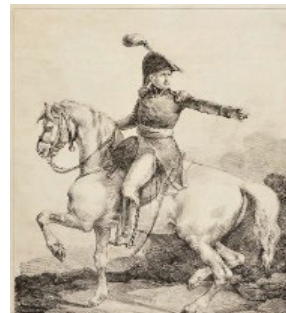
Belgrano. GÉRICAULT, T. Litografías sin colorear.