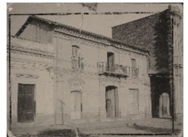
Casa del General Belgrano, Bolívar y Defensa