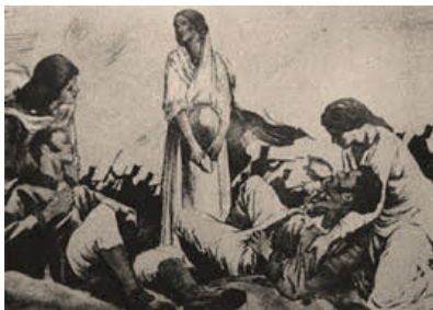
Las niñas de Ayohuma – María Remedios del Valle

María Remedios del Valle, una liberta que acompañó al ejército, es considerada la “Madre de la Patria”. En medio de la batalla de Ayohuma, la “tía María”, una morena bonaerense, junto a sus dos hijas, con quienes lavaba la ropa de la tropa, se encargó de abastecer de agua a los soldados. Ese 14 de noviembre de 1813, las tres mujeres fueron, incansables, a llenar cántaros de agua para aplacar el calor de la tropa en plena batalla. Esta anécdota es relatada por Gregorio Aráoz de Lamadrid en sus memorias.