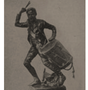
El tambor de Tacuarí. Luis Perlotti