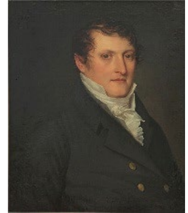
Retrato del Gral. Manuel Belgrano Atribuido a Francois Carbonnier MNBA

El 20 de junio de 1820, en Buenos Aires, pasó a la inmortalidad. Belgrano se convirtió en “militar a la fuerza”, como dijo a San Martín en una carta, y fue parte de tres escenarios determinantes para el destino de la Nación: el Alto Perú, Paraguay y la Banda Oriental. A pesar de las derrotas, las penurias y las dificultades políticas, no dejó de dar pelea, militar e intelectual, por la Patria.