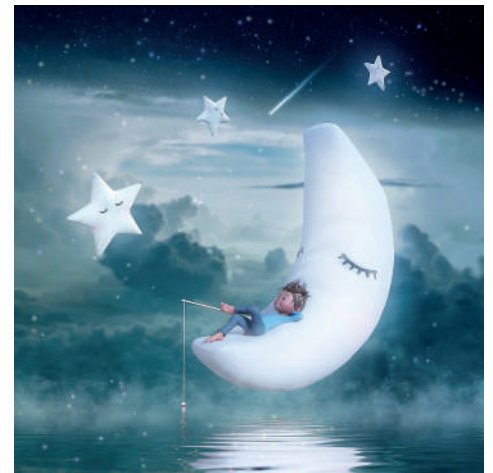
Mysticsartdesign - Pixabay