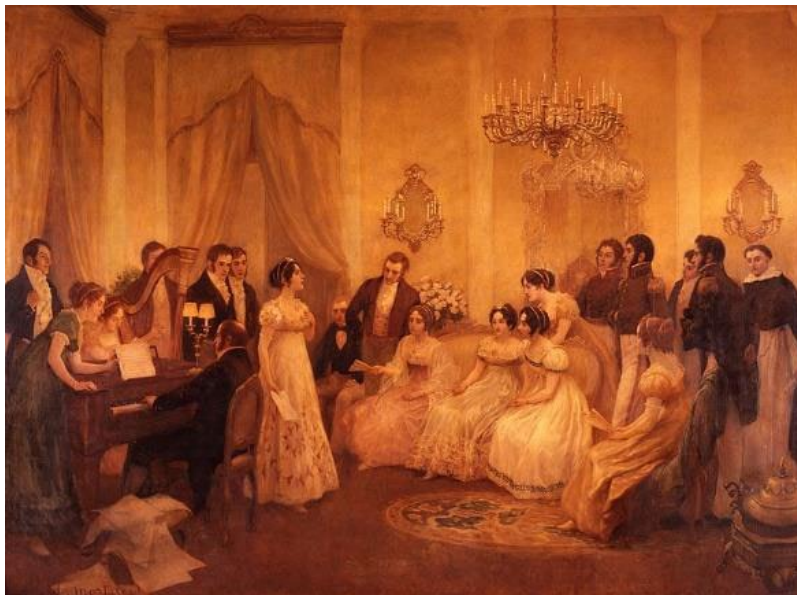
El Himno Nacional Argentino se interpreta por primera vez en la casa de María Sánchez de Thompson, el 14 de mayo de 1813. Obra de Fray Pedro Subercaseaux Errázuriz, 1909.

Tradicionalmente se dice que nuestro himno fue entonado por primera vez por Mariquita Sánchez de Thompson, en su casa. Se cree que la versión surgió a partir de lo escenificado en la obra de Subercaseaux.