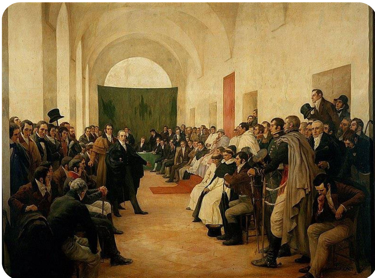
El Cabildo Abierto del 22 de mayo de 1810. Pedro Subercaseaux, 1910. https://commons.wikimedia.org/wiki/File:Cabildo_Abierto_-_Pedro_Subercaseaux.jpg

Celebramos el inicio de la revolución que elegimos como fecha de inicio de nuestra nación. La revolución no tuvo como proyecto la independencia, salvo entre una minoría de dirigentes, sino la autonomía dentro de la monarquía española, pero abrió un proceso que terminó en la creación de un país nuevo.