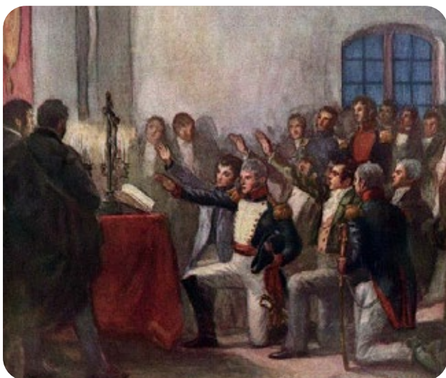
Juramento de la Primera Junta Gubernativa Argentina (25 de mayo de 1810). Pedro Subercaseaux, 1910. https://commons.wikimedia.org/wiki/File:Juramento_de_la_1%C2%B0_Junta_Gubernativa_Argentina_-_Subercaseaux.JPG

El 25 de mayo, las protestas eran incontenibles. La multitud ocupaba nuevamente la plaza. El movimiento patriota estaba cerca del Cabildo. Ni los jefes militares estaban ya del lado del virrey.